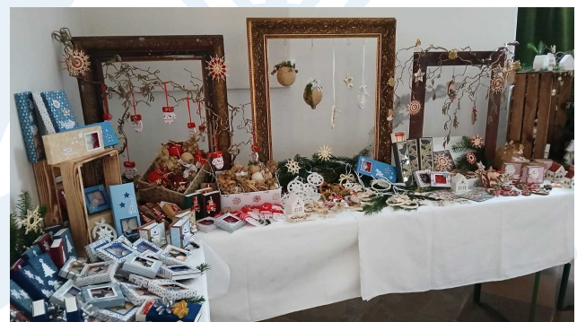
Dabei konnte man Weihnachtsdekoration, Advent- und Türkränze, Weihrauch und vieles mehr kaufen.