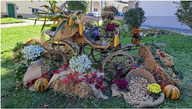
Danke an die Dorfgemeinschaften Loitsbach, Simonsberg, St. Frein, St. Haus für das Erntedankfest!