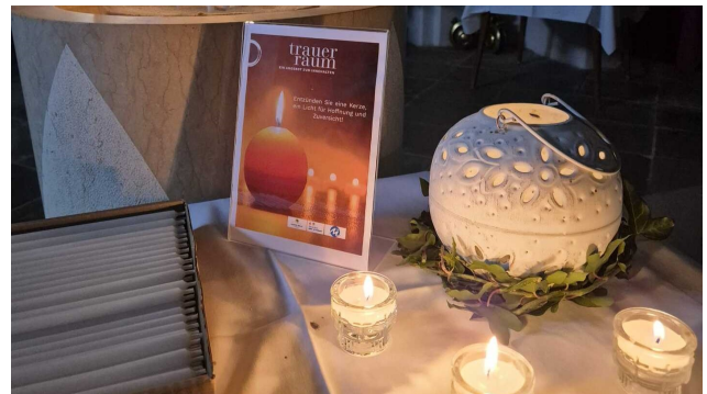
Die Pfarre Mank und der Hospiz Verein Melk gestalteten einen gut besuchten Trauerraum in unserer Kirche.