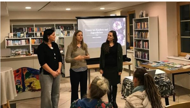
Das KBW Mank und der Elternverein luden zum Vortrag „Trauerarbeit mit Kindern und Jugendlichen“.